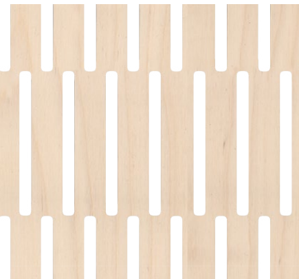
back side: 4/4 mm, plywood birch