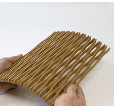
FOLI2, MDF nature 10mm